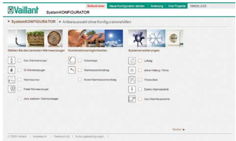
systemKONFIGURATOR unterstützt den Heizungsbauer bei der Angebotserstellung

Heute kann der Heizungsbauer mit dem systemKONFIGURATOR vom einfachsten Standardsystem bis hin zu komplexeren Anlagen das Angebot selbst erfassen und dabei auf die geführte Produkt- und Zubehörauswahl des systemKONFIGURATORS bauen – und das zu jeder Tages- und Nachtzeit.